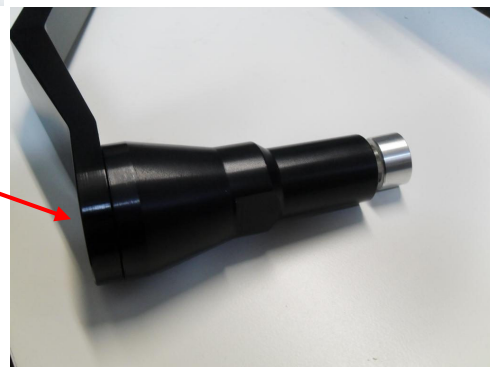
CORPO TAMPONE E BOCCOLA BODY BUFFER AND BUSH

Per poter montare il tampone su staffa 4Racing, allentare il perno che sostiene il Motore.