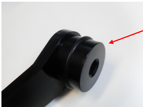
BOCCOLA CON O-RING BUSH WITH O-RING